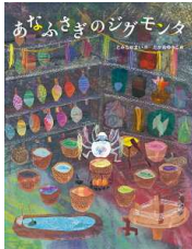
【あなふさぎのジグモタ】