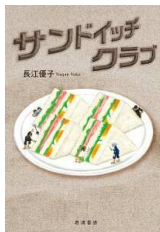
【サンドイッチクラブ】