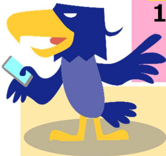
シッタカ