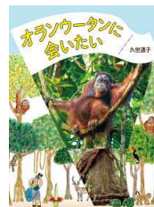
【オランウータンに会いたい】