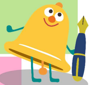
シラベルくん