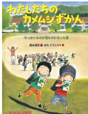
【わたしたちのカメムシずかん】