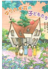
【ゆりの木荘の子どもたち】