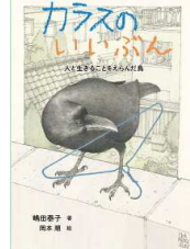
【カラスのいいぶん】