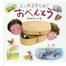
【どこからきたの? おべんとう】