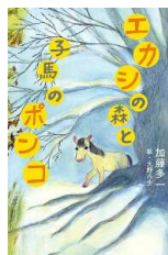
【エカシの森と馬のボンコ】