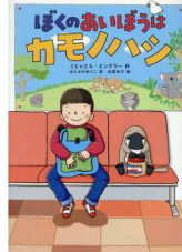
【ぼくのあいぼうはカモノハシ】