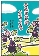
【そのときがくるくる】